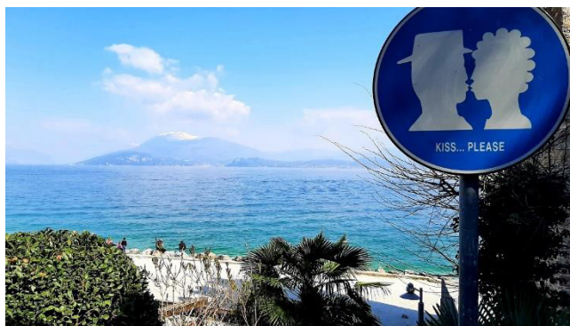
Passeggiata delle Muse mit dem Monte Baldo