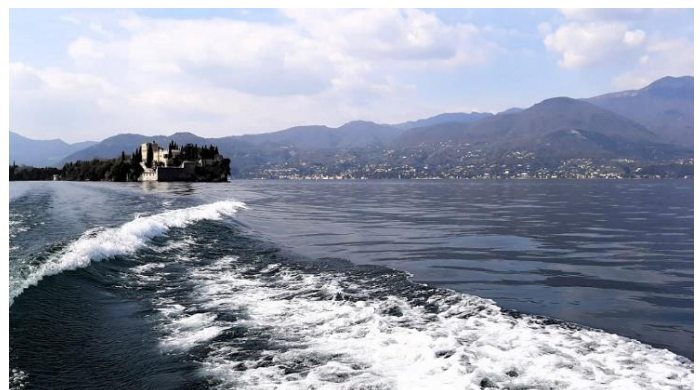
Abschied von der Isola del Garda

Diese erlebnisreiche Tagestour lassen wir schließlich entspannt in einem der Strandcafés in Garda bei einem Eiskaffee ausklingen.