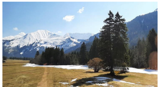
Tirol - Kohlbergspitze 2202 m