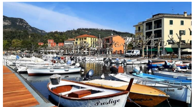
Hafen von Garda