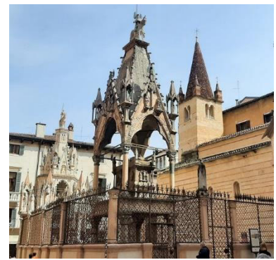
Arche Scaligere und Santa Maria

Weiter geht es zu den gotischen Grabmälern der Familie della Scala, die sich direkt neben der Kirche Santa Maria Antica befinden, sowie zum nahegelegenen historischen Platz Piazza dei Signori. Dieser Platz beeindruckt nicht nur durch seine Architektur, sondern auch durch das monumentale Denkmal von Dante Alighieri.