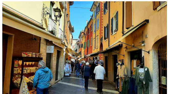
Einkaufsstraße Corso Vittorio Emanuele