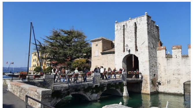
Zugang über die Brücke in die Altstadt

Die ehemalige Wehranlage aus dem 14. Jahrhundert zählt auch heute noch zu den imposantesten Bauwerken am Ufer des Gardasees und ist von nahezu jedem Teil der Stadt aus sichtbar. Über eine Brücke, die an einem großen Hafenbecken vorbeiführt, gelangen wir in die Altstadt.