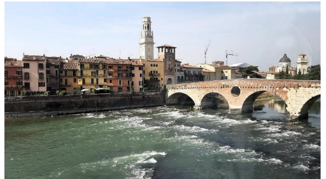
Ponte Pietro mit Kathedrale von Verona

Unser Weg führt uns durch die Altstadt, vorbei am Casa di Romeo und dem Casa di Giulietta – dem berühmten Haus der Julia, ein unverzichtbares Ziel für Liebhaber von Shakespeares Tragödie. Der Innenhof des Hauses ist auch heute ein beliebter Anziehungspunkt, und die Menschen drängen sich, um den Balkon zu sehen, von dem aus Julia laut der Legende ihre berühmten Worte an Romeo richtete.