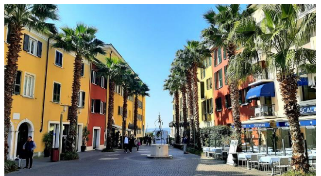
Via Santa Maria Maggiore