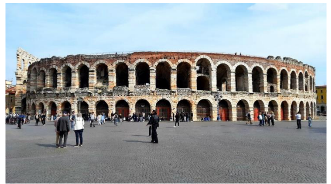
Das beeindruckende römische Amphitheater

Über die elegante Einkaufsstraße Via Mazzini erreichen wir schließlich die Piazza Brà, die mit ihrer historischen Arena weltberühmt ist. Das beeindruckende römische Amphitheater, das im Jahr 30 n. Chr. erbaut wurde und hervorragend erhalten ist, prägt das nördliche Ende der Piazza.