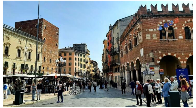
Sozialer Mittelpunkt von Verona

Die Piazza della Erbe, der soziale Mittelpunkt des mittelalterlichen Verona, rundet unser Altstadt-Erlebnis ab. Der Platz vor dem Palazzo Maffei bietet eine einzigartige Kulisse, die durch kunstvolle Fassaden und Monumente bereichert wird.