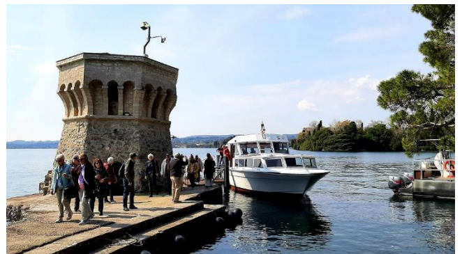
Anleger der Isola del Garda

Während der Führung entdecken wir die unberührte Natur des Parks, die prachtvollen englischen und italienischen Gärten sowie ausgewählte Räume der Villa im venezianisch-neugotischen Stil.