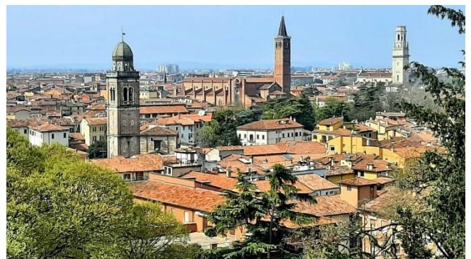
Blick vom Belvedere auf die Dächer von Verona

Der historische Stadtkern von Verona ist seit dem Jahr 2000 Teil des UNESCO-Weltkulturerbes, was ihn umso beeindruckender macht.