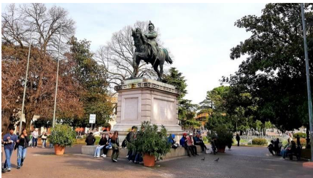
Reiterstandbild von Viktor Emanuel II.

Über die elegante Einkaufsstraße Via Mazzini erreichen wir schließlich die Piazza Brà, die mit ihrer historischen Arena weltberühmt ist. Das beeindruckende römische Amphitheater, das im Jahr 30 n. Chr. erbaut wurde und hervorragend erhalten ist, prägt das nördliche Ende der Piazza.