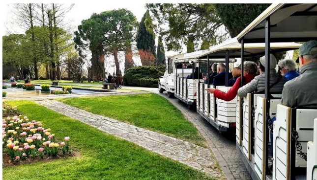
Mit der Bimmelbahn unterwegs

Das ganze Jahr über begeistert der Park mit einer ständig wechselnden Blütenpracht tausender Blumen. Wir haben den perfekten Zeitpunkt für unseren Besuch erwischt: Im März und April erreicht die Tulpenblüte ihren Höhepunkt. Über eine Million Blüten aus rund 300 verschiedenen Tulpensorten verwandeln Wiesen und Beete in ein farbenprächtiges Meer. Ab Mai übernehmen dann mehr als 30.000 Rosen unterschiedlichster Arten die Hauptrolle und sorgen für ein ebenso eindrucksvolles Blütenbild.