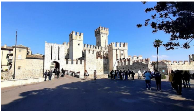
Wasserburg Castello Scaligero

Unser erstes Ziel ist die malerische Stadt Sirmione mit ihrem historischen Zentrum auf einer Halbinsel. Gleich zu Beginn unseres Rundgangs erreichen wir die Wasserburg Castello Scaligero. Die Scaliger (Scaligeri, della Scala) waren von 1262 bis 1387 die Herren von Verona und sind kulturhistorisch vor allem als Erbauer der Scaligerburgen in Oberitalien bekannt.