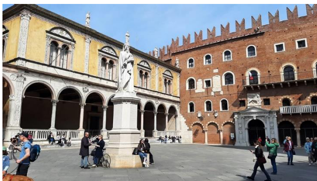
Platz Piazza dei Signori

Weiter geht es zu den gotischen Grabmälern der Familie della Scala, die sich direkt neben der Kirche Santa Maria Antica befinden, sowie zum nahegelegenen historischen Platz Piazza dei Signori. Dieser Platz beeindruckt nicht nur durch seine Architektur, sondern auch durch das monumentale Denkmal von Dante Alighieri.