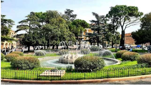
Fontana delle Alpi auf der Piazza Brà