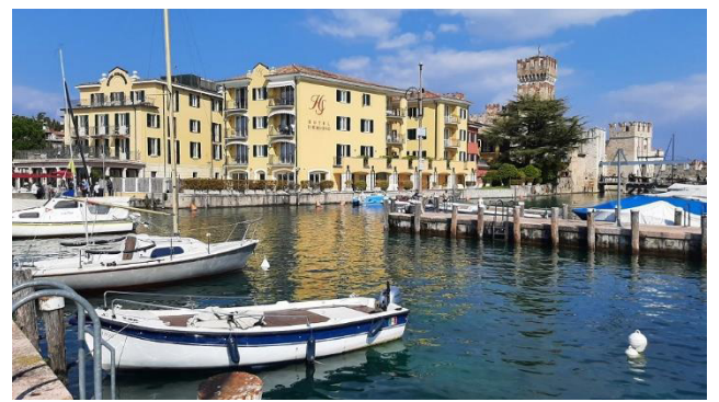
Hafen von Sirmione

Um 14:00 Uhr trifft sich die Reisegruppe wieder vor dem Castello Scaligero, und gemeinsam machen wir uns auf den Rückweg zum Busparkplatz.