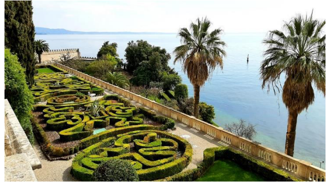
Blick vom Balkon der Villa