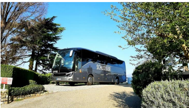
Wir haben das Ziel erreicht

Der höchste Gipfel, der Valdritta-Gipfel, erreicht 2238 Meter.