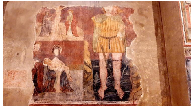
Fresken aus dem 15. Jahrhundert