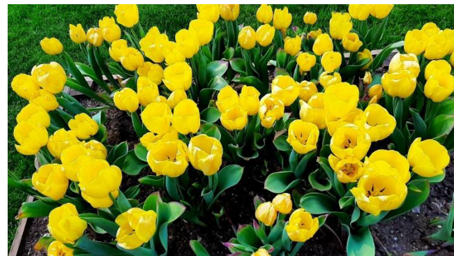
Tulpomnia im Gartenpark

Um 18:00 Uhr kehren wir schließlich in unser Hotel Bellavista zurück und freuen uns auf ein köstliches Abendessen.