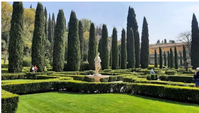
Giardino Palazzo Giusti

Dieser italienische Renaissancegarten, der mit Zypressenalleen, Grotten, Statuen, Steinvasen und einem kunstvoll angelegten Heckenlabyrinth geschmückt ist, zählt zu den ältesten und schönsten Spätrenaissance-Gärten Europas. Seit dem 15. Jahrhundert befindet er sich im Besitz der Adelsfamilie Giusti.