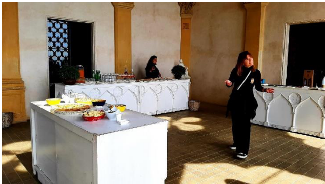
Imbiss mit italienischen Spezialitäten

Ganz im Sinne der Philosophie der Adelsfamilie genießen wir dabei eine persönliche und familiäre Atmosphäre: Auf dem Balkon der Villa werden wir mit einem kleinen Imbiss aus Wein, Oliven und feinen italienischen Spezialitäten empfangen.