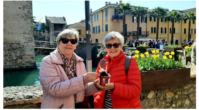
Es schmeckt auch für 10 €

Anschließend besichtigen wir die Kirche Santa Maria Maggiore aus dem 15. Jahrhundert, die mit zahlreichen Fresken aus dieser Zeit beeindruckt. Direkt hinter der Kirche und am Ende der Promenade führen uns einige enge Stufen hinunter zu einem kleinen Strand, der als „Spiaggia del Prete“ oder „Passeggiata delle Muse“ bekannt ist. Von hier aus genießen wir einen herrlichen Blick auf das veronesische Ufer des Gardasees, mit dem Monte Baldo auf der linken Seite und den schimmernden Farben des Sees im Hintergrund.