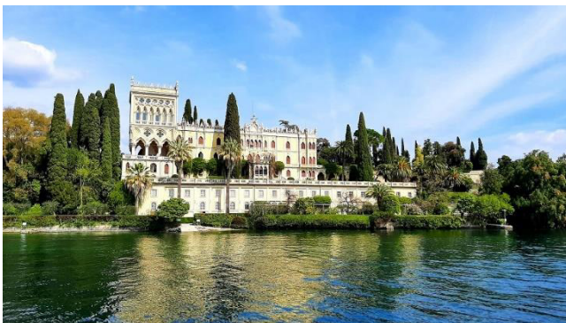
Villa Borghese Cavazza

Die größte Insel im Gardasee befindet sich im Privatbesitz der Adelsfamilie Cavazza, die dort in der venezianisch-neugotischen Villa Borghese Cavazza lebt. Von April bis Oktober öffnet die Familie die Insel sowie die weitläufigen Gärten für geführte Touren und exklusive Veranstaltungen.