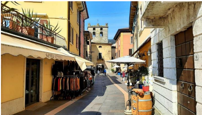
Uhrenturm Torre dell’Orologio

Wir betreten Garda durch den historischen Uhrenturm Torre dell’Orologio und erkunden anschließend die charmante Altstadt. Danach schlendern wir gemütlich entlang der herrlichen Seepromenade, deren Hafen mit den kleinen Schiffen zahlreiche schöne Fotomotive bietet.