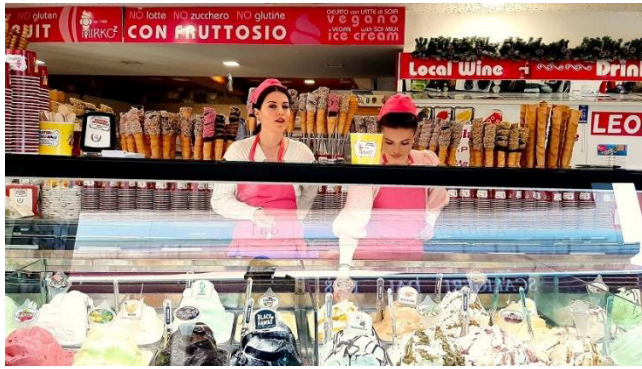
Gelateria bekannt für riesige Portionen