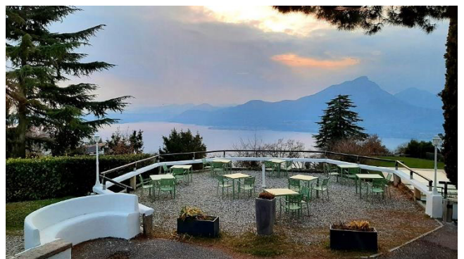
Erster Blick vom Hotel auf den Gardasee