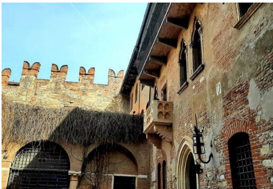
Innenhof und Balkon des Casa di Giulietta

Unser Weg führt uns durch die Altstadt, vorbei am Casa di Romeo und dem Casa di Giulietta – dem berühmten Haus der Julia, ein unverzichtbares Ziel für Liebhaber von Shakespeares Tragödie. Der Innenhof des Hauses ist auch heute ein beliebter Anziehungspunkt, und die Menschen drängen sich, um den Balkon zu sehen, von dem aus Julia laut der Legende ihre berühmten Worte an Romeo richtete.