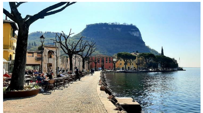
Uferpromenade mit La Rocca di Garda