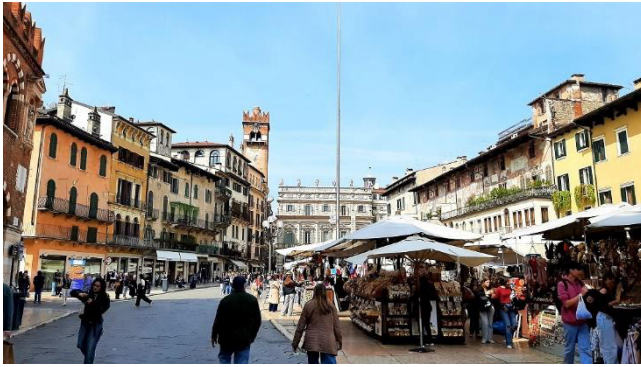
Piazza della Erbe vor dem Palazzo Maffei