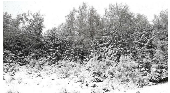
Schneefall auf dem Brennerpass