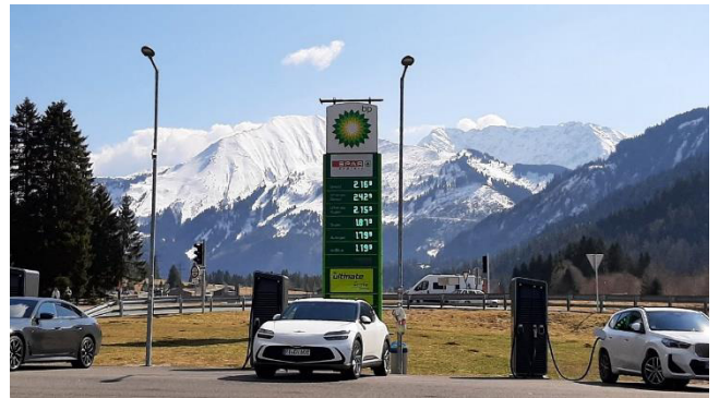
Rasthof in Heiterwang

Für einen kurzen Moment erblicken wir auch die spektakuläre Hängebrücke „highline179“, die mit einer Länge von 406 Metern als derzeit längste Fußgängerbrücke im Tibet-Stil gilt und einen Eintrag im Guinness-Buch der Rekorde verzeichnet.