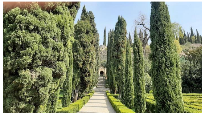
Zypressenallee zur Grotte und Terrasse

Eine Zypressenallee führt uns zu einer unterirdischen Grotte, und von dort gelangen wir auf eine Terrasse, die einen atemberaubenden Blick über den Garten und die Dächer Veronas bietet.