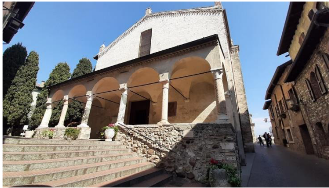
Santa Maria Maggiore

Anschließend besichtigen wir die Kirche Santa Maria Maggiore aus dem 15. Jahrhundert, die mit zahlreichen Fresken aus dieser Zeit beeindruckt. Direkt hinter der Kirche und am Ende der Promenade führen uns einige enge Stufen hinunter zu einem kleinen Strand, der als „Spiaggia del Prete“ oder „Passeggiata delle Muse“ bekannt ist. Von hier aus genießen wir einen herrlichen Blick auf das veronesische Ufer des Gardasees, mit dem Monte Baldo auf der linken Seite und den schimmernden Farben des Sees im Hintergrund.