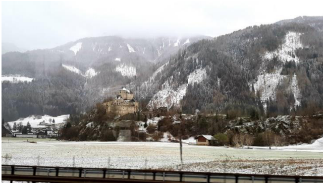
Burg Reifenstein im Eisacktal

Kurz vor dem Brenner setzt plötzlich Schneefall ein, und in den höheren Lagen bleibt der Schnee sogar liegen. Die Räumdienste sind bereits im Einsatz. Der Winter zeigt sich noch einmal von seiner weißen Seite – für uns hoffentlich zum letzten Mal in dieser Saison.