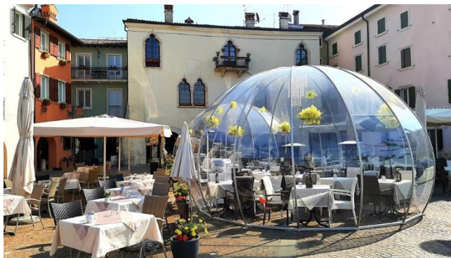
Cafe auf der Uferpromenade