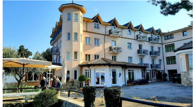
Hotel Bellavista San Zeno di Montagna