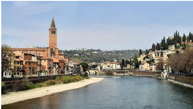
Die Etsch mit Basilika Santa Anastasia

Zur Mittagszeit überqueren wir zu Fuß die Etsch über die Ponte Nuovo und erreichen das lebendige Stadtzentrum.