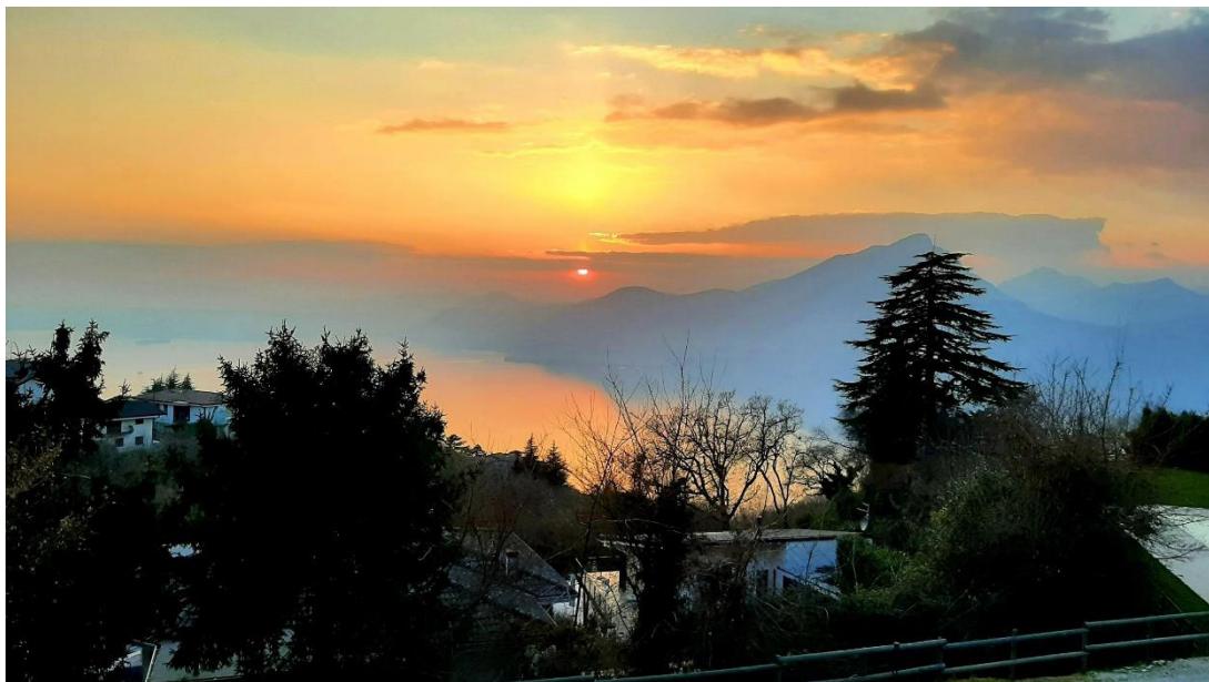
Malerischer Sonnenuntergang über dem Gardasee - Blick vom Hotel

Den Abend lassen wir mit einem Aperol Spritz an der Hotelbar ausklingen und genießen noch einmal die entspannte Urlaubsatmosphäre.