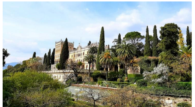
Die Villa mit Gewächshaus und englischem Garten