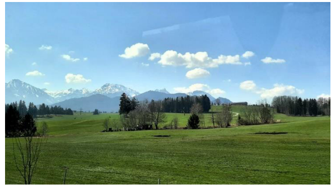
Voralpenlandschaft mit Ammergauer Alpen