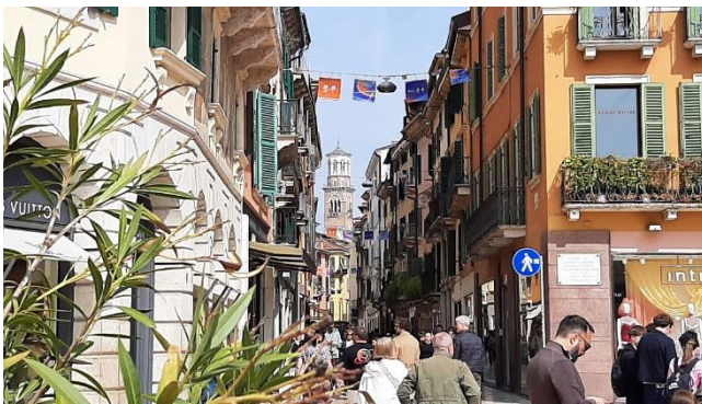
Einkaufsstraße Via Mazzini

Auch heute findet dort ein lebendiger Markt statt, der von Feinkost bis Souvenirs alles für die zahlreichen Besucher bietet.