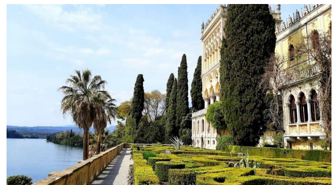
Gepflegte italienische Gärten