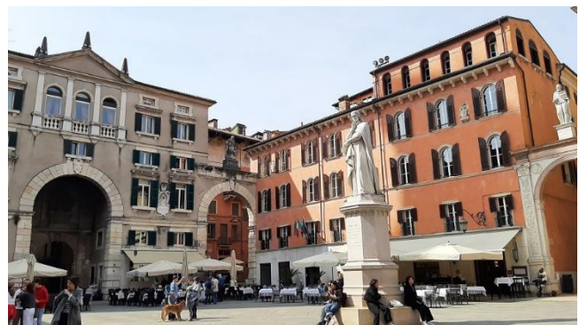
Monumentales Denkmal von Dante Alighieri