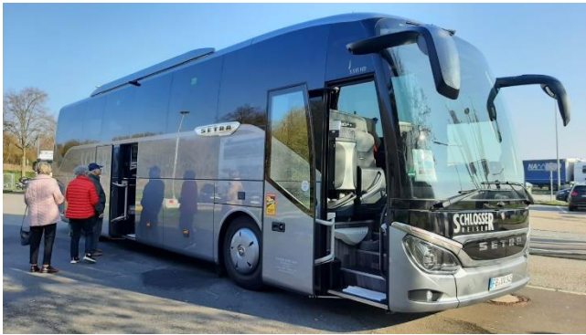
Warten auf den Kaffee

Pünktlich um 06:10 Uhr werden wir vom Zubringerbus der Firma Schlosser direkt an der Haustür abgeholt. Gemeinsam mit Irene, Horst und weiteren Gästen aus Bischofsheim fahren wir zunächst zum Rasthof Weißkirchen. Dort steigen wir in unseren Reisebus um, der gegen 07:00 Uhr in Richtung Süden startet.