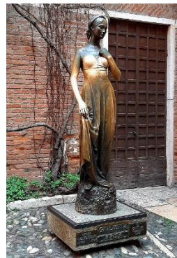
Statue der Julia